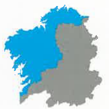
Demarcación Hidrográfica Galicia - Costa